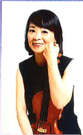
「ヴァイオリン演奏」