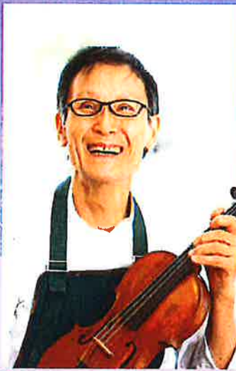
「津波ヴァイオリンの制作」