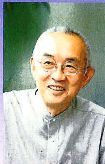
「地域から変革する日本」